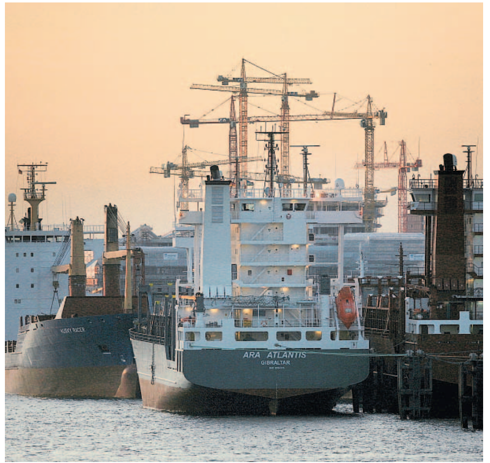
Im Sonnenuntergang liegen mehrere Containerschiffe im Hafen Hamburg. Obwohl die deutschen Exporte im Oktober gesunken sind, rechnen Fachleute mit einem Rekordjahr.

Die Bundesbank sieht im Inland alle Voraussetzungen für einen langen, breit angelegten Aufschwung intakt: „Angesichts des hohen Offenheitsgrades sind für die deutsche Wirtschaft aber Nachfrageimpulse aus den